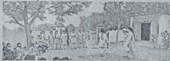
पिण्डोरिया गांव के नुक्कड़ नाटक करके लोगों को जागरूक करती छात्राएं - जगदश