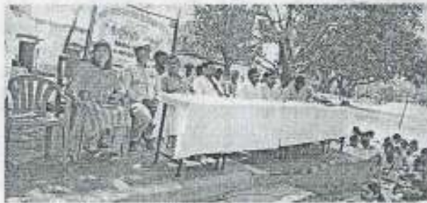
पिंडोरिया में आयोजित एनएसएस शिविर में मंचारोपन रिसेप्शन • जागरूक

कार्यक्रम को संबोधित करते हुए प्राचार्य ने राष्ट्रीय सेवायोजना एक ऐसा प्लेटफार्म है, जहां विद्यार्थियों को न केवल शैक्षिक विकास होता है बल्कि मानसिक, शारीरिक और व्यक्तित्व विकास भी होता है। यह शिविर सात दिन घर परिवार के वातावरण से दूर होकर कुछ नया सीखने तथा समाज को जागरूक