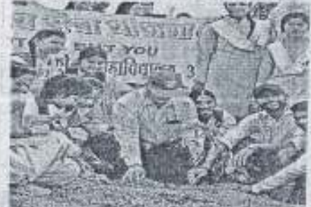
पिण्डोरिया गांव में पौधारोपण करते छात्र छात्राएं

संवाद सूत्र, अमेठी : आरआरपीजी की राष्ट्रीय सेवायोजना इकाई की ओर से श्री रामबली सिंह उच्चतर माध्यमिक विद्यालय पिण्डोरिया में सात दिवसीय दिन रात विशेष शिविर का आयोजन किया गया। पांचवें दिन शिविरार्थियों ने चयनित गांवों में जाकर टूटे-फूटे चकमार्ग और खडंजा मरम्मत का कार्य किया। पौधारोपण के साथ ही पुराने व नए हैडपंप के आसपास साफ सफाई स्वयंसेवक और सेविकाओं की तरफ से किया गया। बंद पड़े कुओं को ढककर रखने की अपील की गई। मध्यान भोजन के उपरान्त स्वच्छ भारत, स्वस्थ भारत विषय पर एक पोस्टर प्रतियोगिता का आयोजन किया गया। सभी प्रतिभागियों ने पोस्टर बनाए। प्रथम तीन स्थान प्राप्त करने वालों को पुरस्कृत भी किया गया।