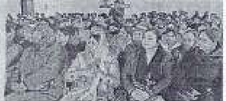
स्वामी विवेकानंद की जयंती के अवसर पर कलकत्ता में आयोजित कार्यक्रम में भाग ले रहे छात्रों का दृश्य।

अमेठी के विभिन्न आर.आर.पी.जी. कालेजों में स्वामी विवेकानंद की जयंती के अवसर पर कार्यक्रम आयोजित किए गए। कार्यक्रमों के माध्यम से उनके जीवन और विचारों का प्रचार किया गया।