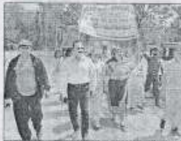
अमेठी में बुधवार को जागरूकता रैली निकालते एनएसएस शिविरार्थी • संवाद

शहर स्थित रणवीर रणजय स्नातकोत्तर महाविद्यालय के राष्ट्रीय सेवा योजना इकाई के तत्त श्रीरामबली सिंह उच्चतर माध्यमिक विद्यालय पिण्डोरिया में सात दिवसीय अंतरराष्ट्रीय विशेष शिविर चल रहा है। शिविर के दूसरे दिन यह स्वयंसेवकों ने विद्यालय समेत कई गांवों पर स्वच्छता अभियान चलाया। शिविरार्थियों ने ग्रामीणों के साथ स्वच्छता के तत्व पर चर्चा करते हुए कहा कि अपने