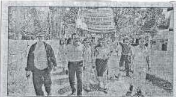
एनएसएस के छात्र और शिक्षक सोमवार को रैली निकालते हुए • केन्द्रीय