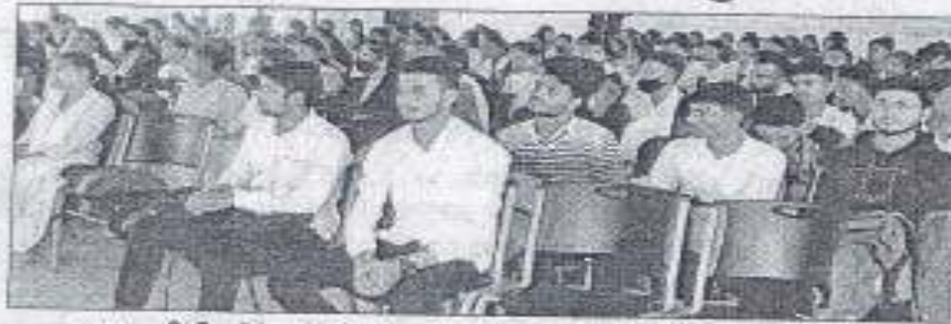
आरआरपीजी कॉलेज में सोमवार को आयोजित गोष्ठी में मौजूद विद्यार्थी। -संवाद