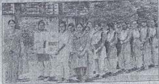
सड़क सुरक्षा के तहत प्रभात फेरी निकालती आरआरपीजी कालेज की छात्राएं

प्रभात फेरी के दौरान छात्राओं ने लोगों को बताया कि सड़क सुरक्षा के नियमों का पालन कर अपनी व परिवार